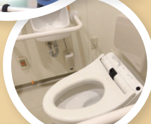
▲ 家居環境評估及改裝